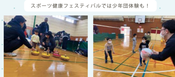
スポーツ健康フェスティバルでは少年団体体験も！

※ 日程は変更になる場合もあります。また、事前申込が必要なイベントもありますので、最新・詳細情報をご確認ください。